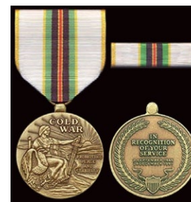
Холодная война укрепляя мир и стабильность в признание вашей службы 2 сентября 1945 – 26 октября 1991

Константинополь и вслед за этим начался расцвет западной Европы и в первую очередь Венеции, через которую везли награбленное, — так и в 1990-е годы Европа создала второй центр неконтролируемой эмиссии на материальной базе богатств из ограбленного СССР.