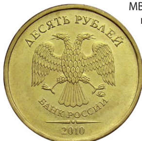
Русский двуглавый орел на гербе РФ и орел с «кренки» на рублях